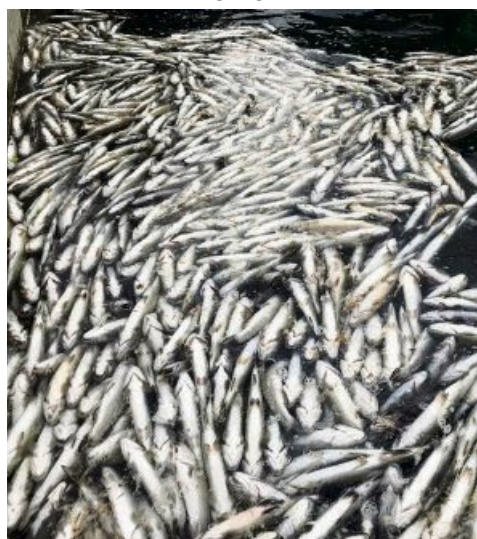
Im Blausee verendeten Tausende Fische.

BERN. Zur illegalen Ablagerung von Gleisschotter auf dem Gelände eines Steinbruchs in Mitholz wird es keine parlamentarische Untersuchungskommission (PUK) geben. Der bernische Grosse Rat hat gestern einen entsprechenden Vorstoss der Grünen mit 132 zu 10 Stimmen abgelehnt. Der Rat folgte damit den Anträgen seines Büros und seiner Geschäftsprüfungskommission (GPK). Büro und GPK hatten geltend gemacht, es reiche, wenn die GPK die Angelegenheit untersuche. SDA