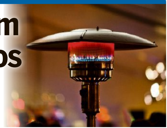
Auf solche Wärmestrahler setzt der Wirtepräsident.

Die Regelung beschränkt sich aber auf den öffentlichen Grund. Hat eine Beiz einen privaten Garten oder eine private Terrasse, darf sie dort Heizstrahler verwenden, wie Esseiva bestätigt. Weder die Stadt noch der